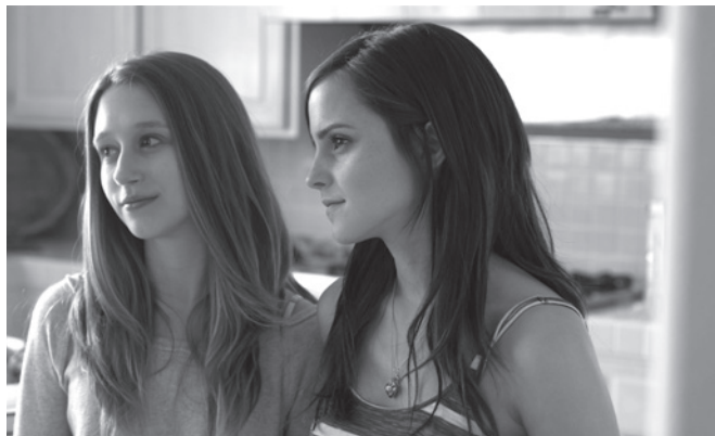
Contempler le mal de vivre

Si The Bling Ring joue sur des bases déjà bien tracées, il n'est pas moins intéressant. Cet intérêt est double. D'une part, on se demande en le regardant: quelle place prend-il dans le corpus de son auteure? À quarante ans, Sofia Coppola arrive à l'heure des premiers bilans de son cinéma. D'autre part, il convient de rappeler la proximité de son dernier film avec deux autres sortis durant les derniers mois, Spring Breakers et After Lucia , qui – à leur manière tout à fait opposée (la vulgarité clipsique de Korine vs le réalisme documentaire de Franco) – partagent le même sujet, à savoir une jeunesse à la dérive souffrant de l'absence / indifférence de son entourage ( After Lucia ), projetée dans un fantasme toxique ( Spring Breakers , The Bling Ring ).