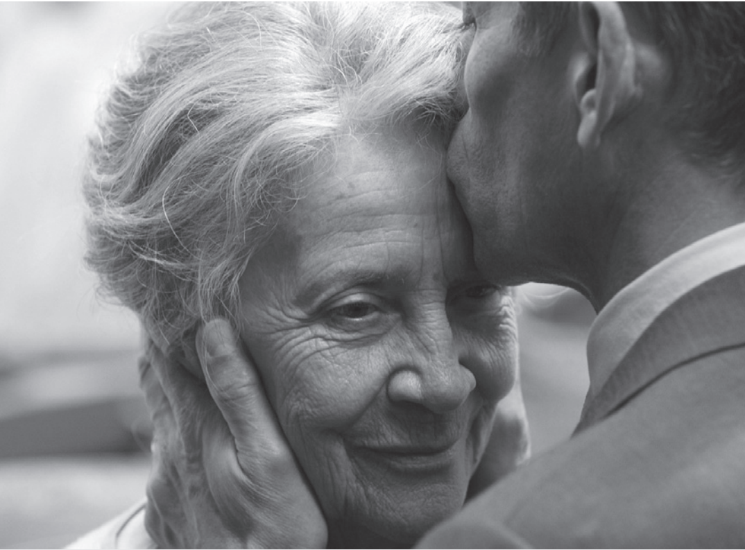
L'amour de la mère dans toute sa générosité

son père mort sur les champs de bataille de la Première Guerre mondiale, alors que l'auteur en devenir n'était qu'un bambin.