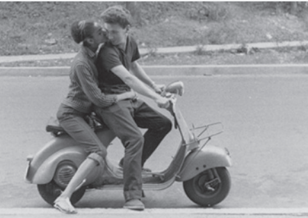
À tout prendre