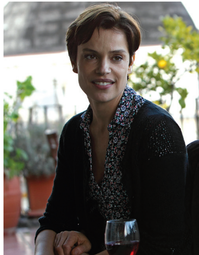
Micaela Ramazzotti et Elio Germano

Je vous remercie de ce beau compliment. Je me souviens très peu de cette entrevue. Elle est importante pour celui qui la lit, mais pas pour moi. C'est ainsi que j'ai voulu qu'elle soit. Personnellement, je n'ai pas besoin de coming out . Je vis selon mes principes de liberté et en toute sincérité. Mais je sais que mes mots ont aidé ceux qui ne peuvent pas se permettre de s'exprimer plus librement parce qu'ils vivent dans des contextes sociaux peu enclins à ce genre de discours. Il est nécessaire que ceux qui ont le privilège de le faire fassent entendre leur propre voix. Il n'y a rien de courageux dans cet acte. C'est un devoir.