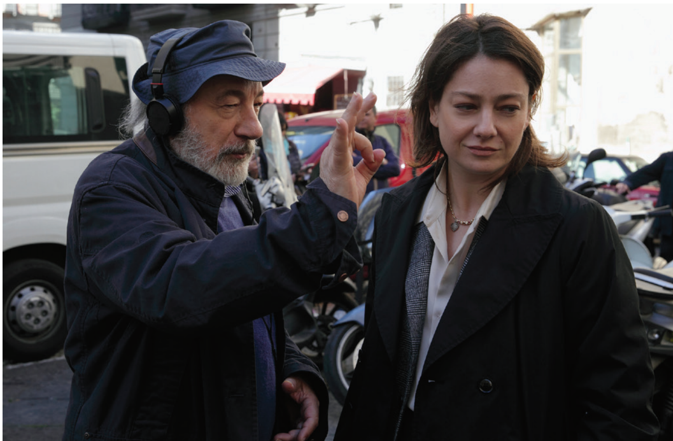
Gianni Amelio en tournage