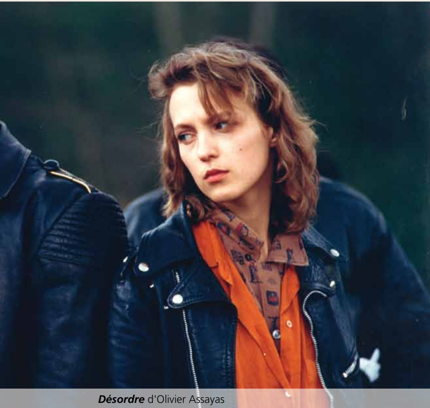
Désordre d'Olivier Assayas

rempoignent. C'est plutôt marrant de voir les réactions que l'émission suscite. Parfois, je rencontre des gens qui m'en parlent. Des gens plus jeunes aussi... Je me dis que je me reconnecte avec une nouvelle génération à travers cette expérience-là.