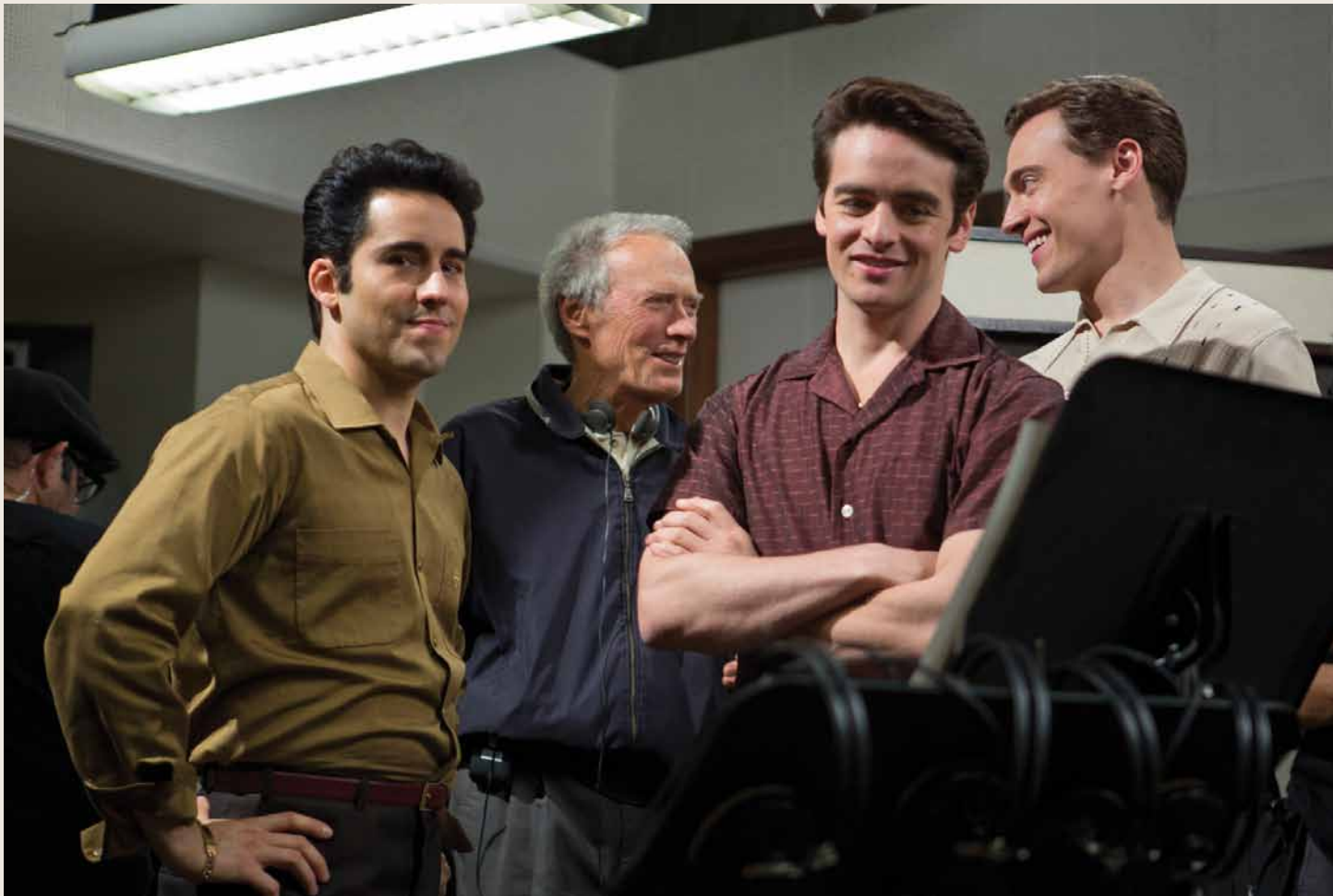
Clint Eastwood entouré de comédiens de Jersey Boys

C'est une question à laquelle je ne peux pas répondre. Il faudrait que j'y réfléchisse davantage. En tout cas, c'est quelqu'un qui doit prendre en compte la situation dans laquelle le cinéma et la critique sont.