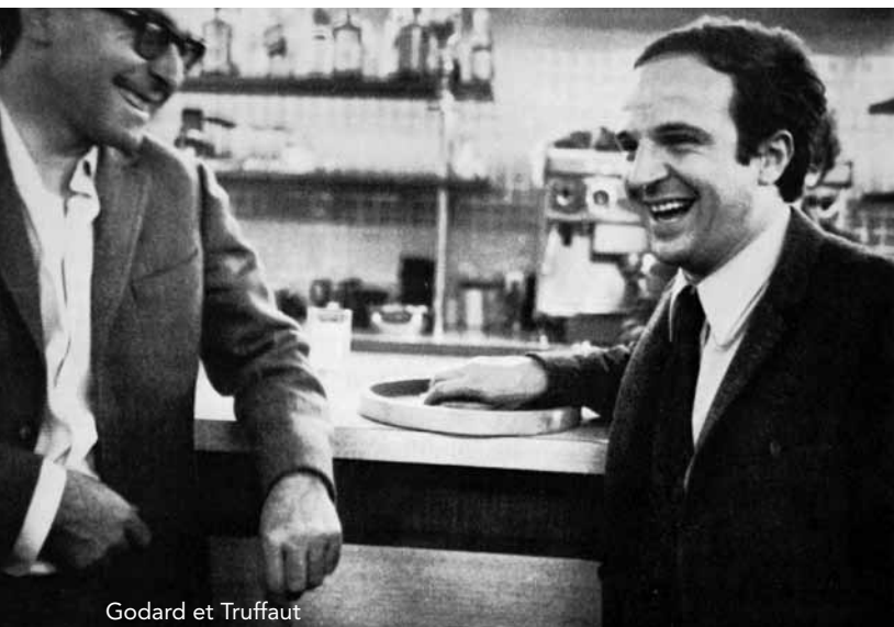
Godard et Truffaut