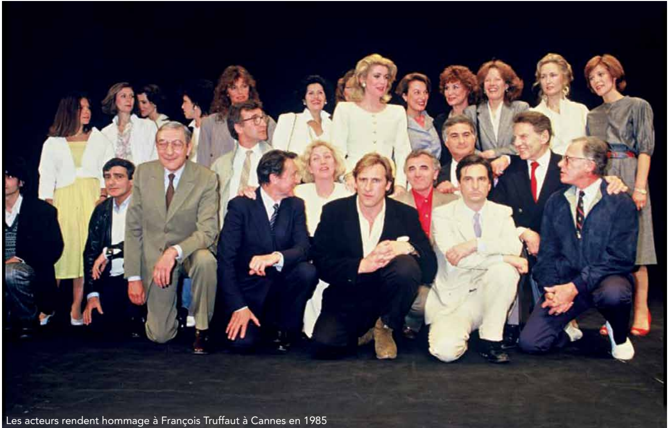
Les acteurs rendent hommage à François Truffaut à Cannes en 1985

«Je tenais mordicus à ces deux fameuses lettres, horribles, où ils s'étaient jeté leurs quatre vérités à la figure. L'un disait "Tu es un menteur", l'autre: "Tu es un salaud". Leur violence était d'autant plus grande méchanceté qu'ils se connaissaient intimement!»