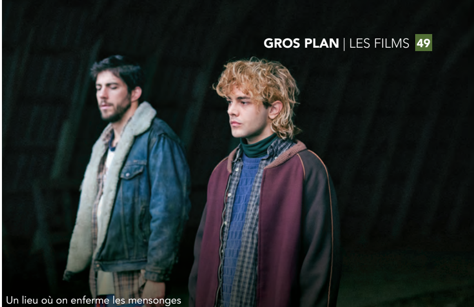
Un lieu où on enferme les mensonges

Si les décors, la direction artistique et les images contribuent à nous enfermer dans ce huis clos à ciel ouvert, et à traduire une esthétique du mensonge et du non-dit, c'est sans conteste la trame sonore qui contribue à faire de cette campagne brumeuse un lieu