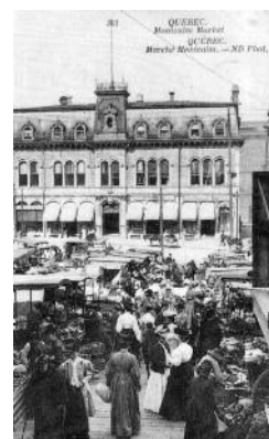
Marché Montcalm à Québec, p. 6