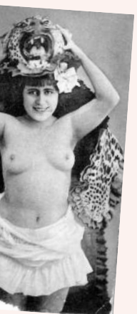
Carte envoyée le 2 septembre 1915