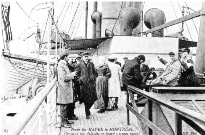
Traversée Le Havre-Montréal, p. 10

transport des résidents du lieu. Quant à la langue d'affichage dans les villes... la « loi 101 » viendra beaucoup plus tard.