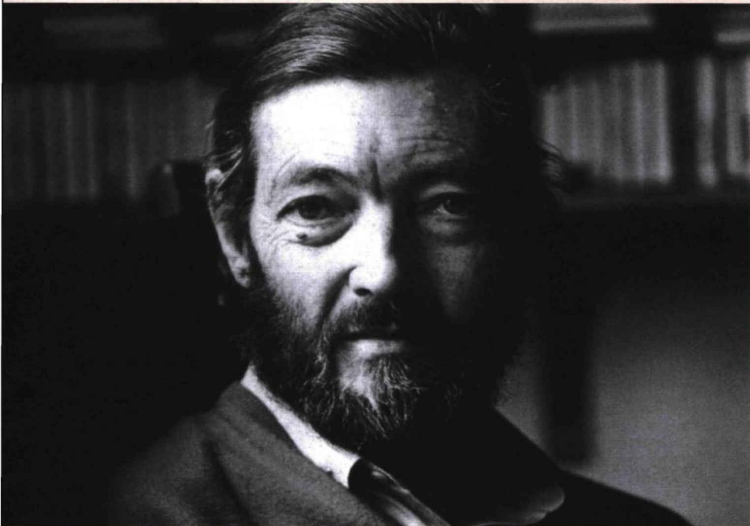
Julio Cortázar