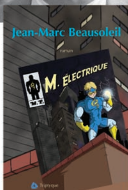
JEAN-MARC BEAUSOLEIL Monsieur Électrique roman, 189 p., 22 $