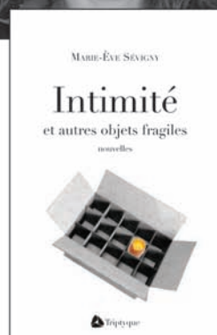
MARIE-ÈVE SÉVIGNY Intimité et autres objets fragiles nouvelles, 100 p., 18 $