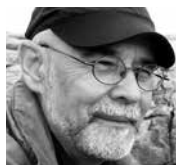
Par JEAN DÉSY*

Ma Côte-Nord commence à Franquelin Souvenir d'une centaine de moyacs cancanantes Folles de vie-février dans un chorbac Puis il y a Pentecôte et sa gueule de rivière Lieu de haute puissance pour se métamorphoser En truite de mer ou en flétan Dix kilomètres plus loin c'est Baie-des-Homards Et ses masses de moules et de myes Sans compter les crabes et les homards succulents