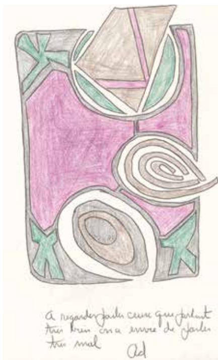
À regarder parler ceux qui parlent très bien on a envie de parler très mal p. 31

Nous connaissons déjà des collages qui avaient été exposés. Ici les dessins jaillissent d'abondance par l'emploi exclusif de crayons de couleur. Notre étonnement est immédiat, qui vaudrait aussi pour la lecture de ses livres : « Où