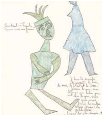
Rimbaud en Tauride. Comme avec une femme... p. 68