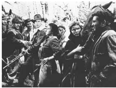
Pour qui sonne le glas (1943) d'après Hemingway

Le récit refait donc la chronique d'un village, qui suit les faits et gestes de quelques personnages représentatifs, ce qui les unit, et ce qui les sépare de plus en plus à mesure que les franquistes gagnent du terrain et que les esprits s'angoissent et se durcissent. Défilent ainsi Joseph (tué dans une absurde escarmouche), Diego, jeune époux de Metse, rigide dans le style commissaire du peuple stalinien et qui sombrera dans