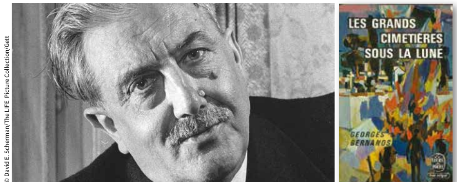
Georges Bernanos en 1946

fournit la liste) cautionnant les tueries et bénissant les canons de Franco et de ses sbires. Bernanos horrifié dénonce les atrocités commises au nom de la croisade antibolchevique. Pour le lecteur d'aujourd'hui qui n'a pas une connaissance précise de la France politique d'avant-guerre, le livre est parfois peu intelligible, bien des références et allusions lui échappent, noyées dans un discours diffus et répétitif. Inlassablement