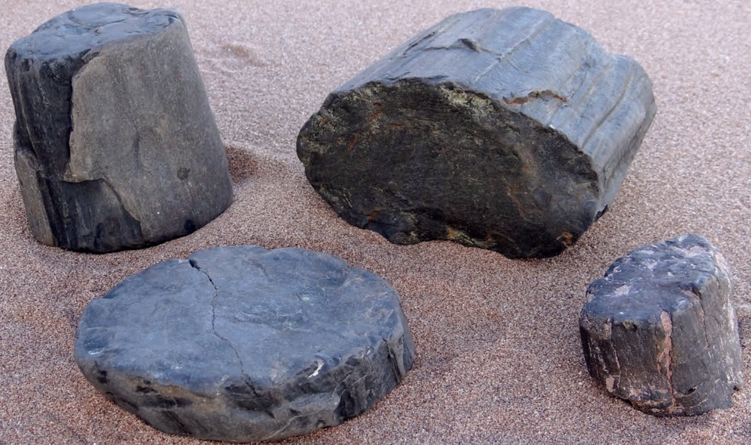
Des pièces de bois pétrifié à Seal Cove. Collection Jocelle Cauvier