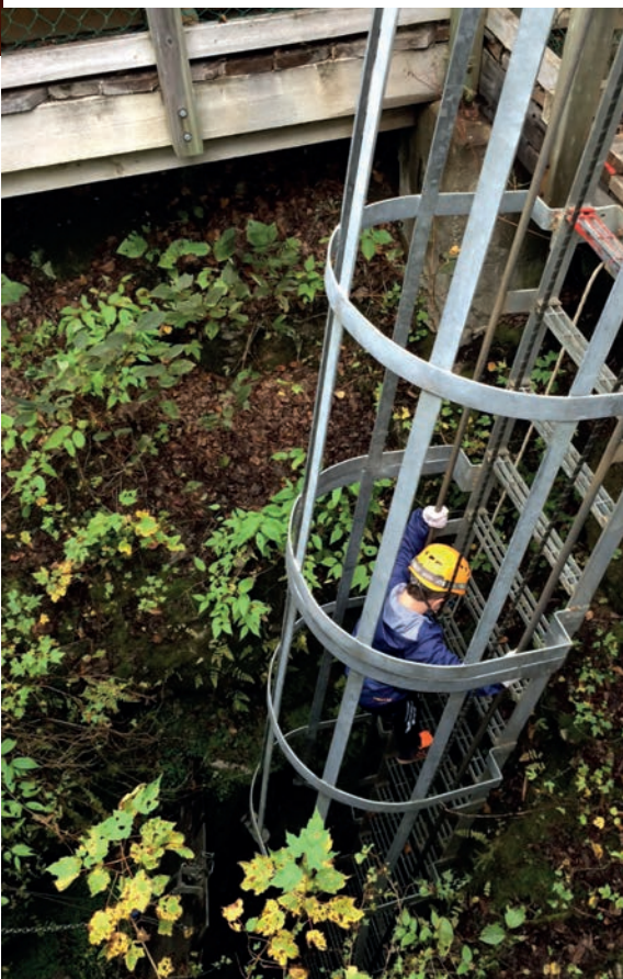
Puits d'ouverture de la grotte de Saint-Elzéar aménagé pour faciliter l'accès aux visiteurs.

Fait intéressant, on y retrouve des crânes et ossements d'ours couverts d'une couche de plusieurs millimètres de calcite, indice de leur