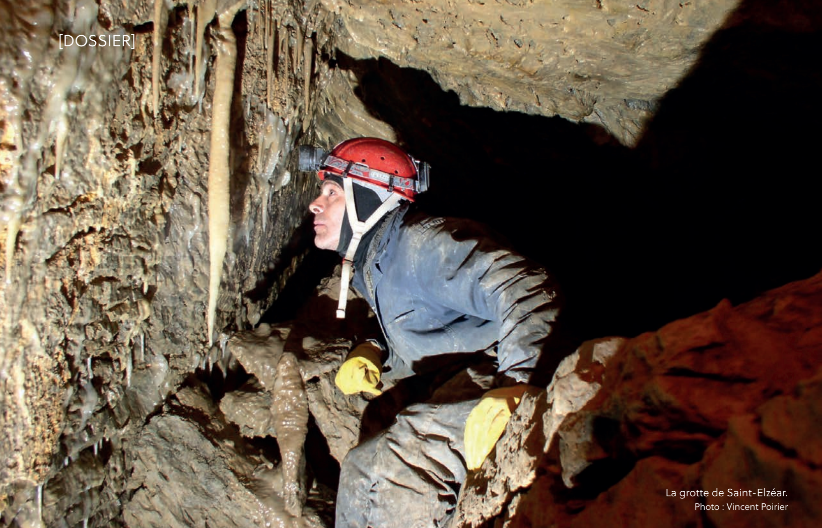
La grotte de Saint-Elzéar.