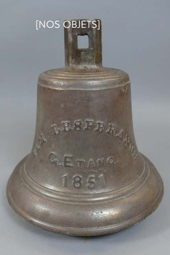
Cloche de la chapelle de la seigneurie de L'Anse-à-l'Étang, 1851.

Gestionnaire des collections, Musée de la Gaspésie