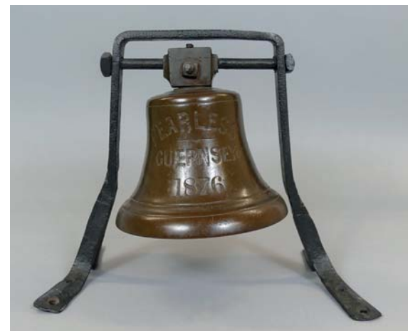
Cloche du Fearless , devenue la cloche d'une école à Percé, 1876.