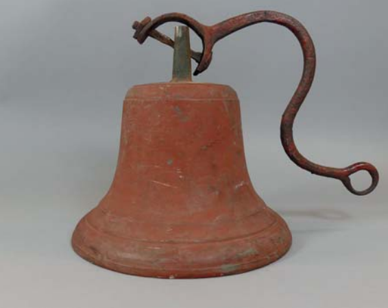
La cloche de l'entrepôt d'huile de foie de morue à L'Anse-à-Beaufils, 1897.