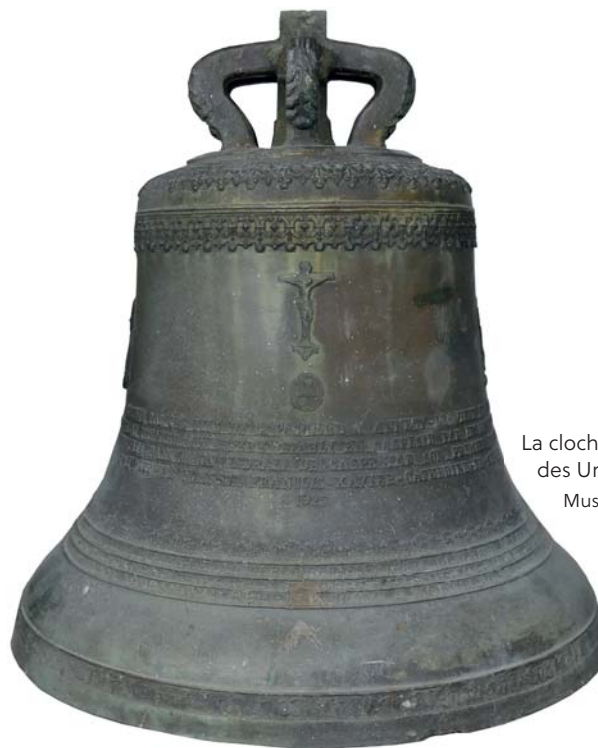
La cloche du monastère des Ursulines, 1925.