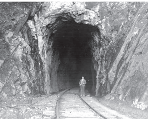
Le tunnel qui perce le cap de l'enfer à Port-Daniel impressionne les voyageurs.

Photo : Musée de la Gaspésie. Collection Centre d'archives du Musée de la Gaspésie. P57/1/42