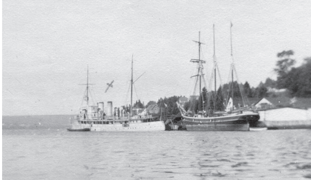
« Gaspé, un des plus beaux havres du monde » accueille le bateau-vapeur Le Margaret et un voilier à trois mâts, août 1919.

Photo : Musée de la Gaspésie. Collection Centre d'archives du Musée de la Gaspésie. P57/1/42