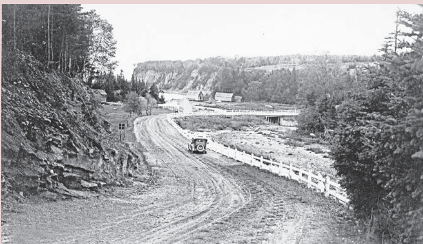
L'automobile représente une nouvelle recrue sur la route de terre de l'Anse-à-Brillant en 1930. Seulement un an après la finition de la ceinture routière quelque 2 015 Gaspésiens possèdent déjà leur automobile. Ces véhicules motorisés sont l'apanage de quelques notables.

Sur la nouvelle route 6 du très accidenté littoral nord, comme ici à l'entrée du village de Rivière-à-Claude, la prudence est de mise pour les automobilistes. Dans son guide touristique de 1930, le ministère de la Voirie ne ménage pas d'en avertir des dangers : « [...] la prudence la plus élémentaire commande donc de donner un avertisseur nécessaire avant de contourner les nombreuses courbes de la route. [...] Longtemps après qu'il a escaladé cette longue rampe, le touriste se souvient des précipices et des ravins, des gorges et des abîmes qui s'ouvrent à des profondeurs illimitées, et un soupir de soulagement soulève sa poitrine lorsqu'il se trouve sur la rampe qui le conduira de nouveau à un niveau moins levé, et plus près du sein de la terre 2 . » Afin de ne pas trop effrayer les touristes, l'édition du guide de 1933 atténue quelque peu sa prose descriptive des dangers !