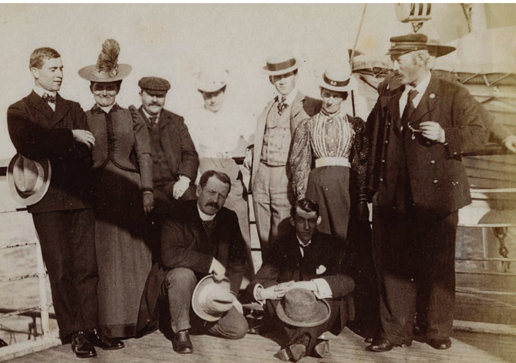
Touristes britanniques en route vers la Gaspésie à bord du S.S. Parisian , vers 1890.

Photo : Musée de la Gaspésie, collection Richard Gauthier, P162/5/80/24