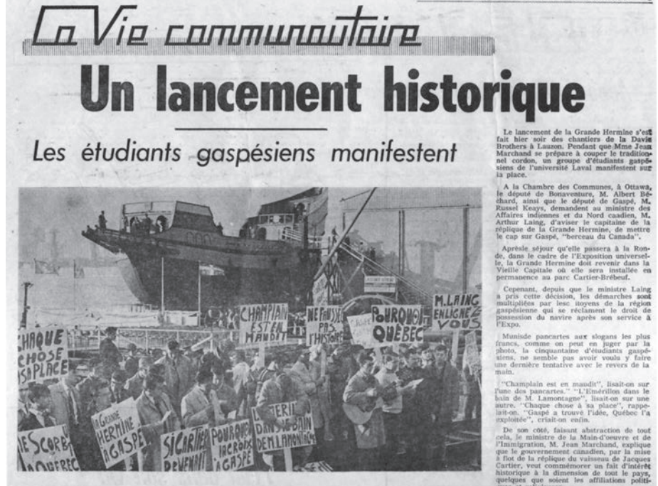
La manifestation des étudiants attire l'attention de la presse dont cet article de L'Événement du 28 octobre 1966.