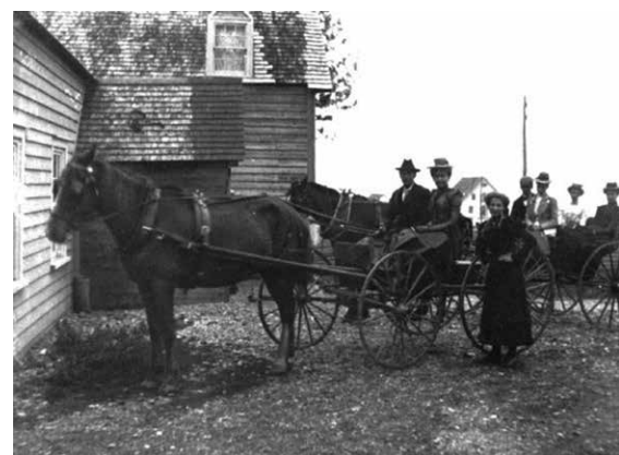
Sortie du dimanche à Pointe-Saint-Pierre.