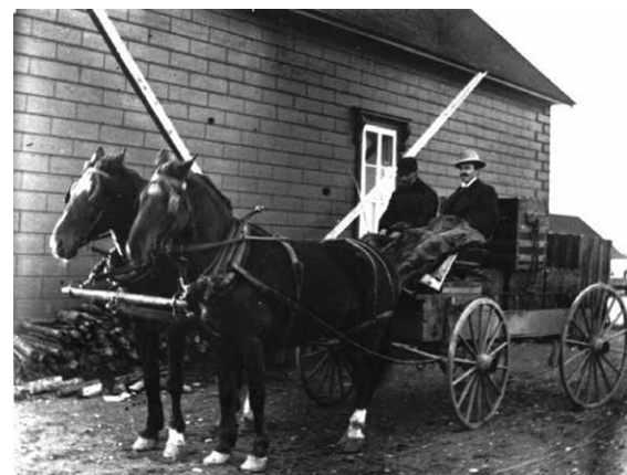
Retour de la poste à Pointe-Saint-Pierre.

Toutefois, Winnifred semble continuer à parfaire son éducation durant sa maladie, car on retrouve des traces dans ses boîtes de souvenirs, de notes