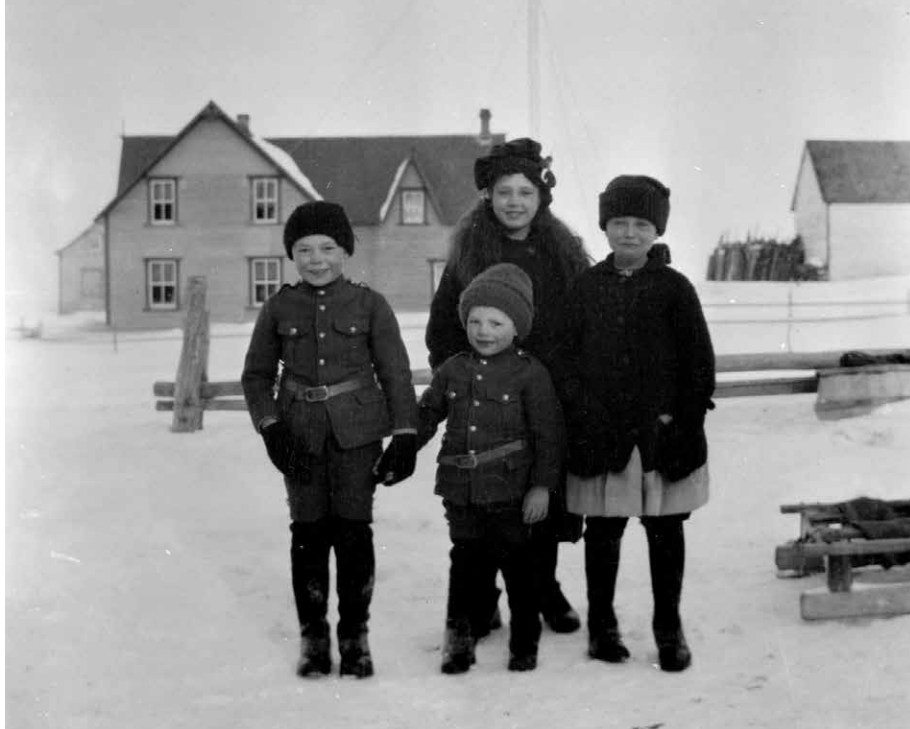
L'hiver à Pointe-Saint-Pierre. Maison LeGros à l'arrière. P250/8/8/21

une parfaite descendante anglaise et jersiaise, éprouve un immense bonheur. L'heure du thé est prétexte à rencontrer les membres de sa famille éloignée de passage et ses amies proches pour échanger potins et nouvelles. Les parties de cartes sont également un rendez-vous fréquent visant à jumeler plaisir et stratégie! Les événements plus fortuits comme les funérailles d'un proche sont également des moments de rencontres et de recueillement communautaire. Il n'est pas rare qu'elle se rende au cinéma à Barachois, qu'elle fasse une tournée de visites à Malbay ou à « Anse-Brillant » (notez la graphie française qu'elle utilise plutôt que Brillant's Cove ) ou qu'elle assiste à des événements plus mondains tels que le