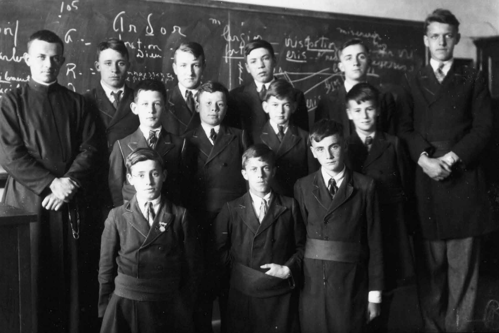
René Lévesque fréquente le Séminaire de Gaspé de 1933 à 1938. Il est le premier de la deuxième rangée sur cette photo de sa classe en Éléments Latins. Élève surdoué, Lévesque remporte sans grands efforts, plusieurs premiers prix à la fin de son année scolaire 1933-1934: Prix spécial en Éléments-Latins, prix spécial d'excellence, premier prix d'orthographe, premier prix de narration française, premier prix de thème latin, premier prix de version latine, premier prix d'histoire du Canada, deuxième prix de préceptes français et latins. Et il maintiendra cette belle moyenne au cours de ses quatre autres années au Séminaire de Gaspé.

Photo : Musée de la Gaspésie, fonds du Séminaire de Gaspé, P69.