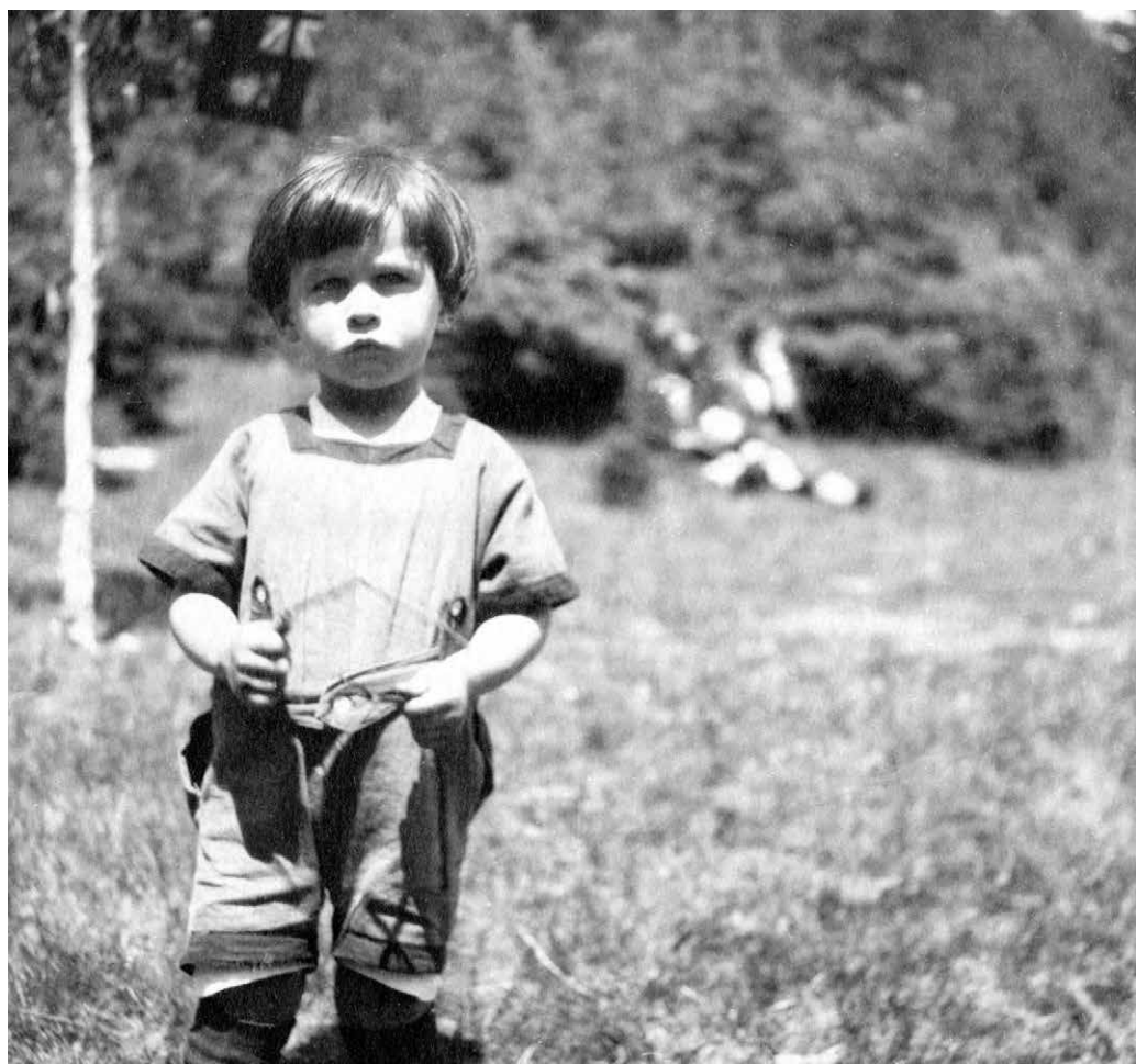
René Lévesque à trois ans.

[...] D'une saison à l'autre (à New Carlisle), nous courions ainsi de la forêt à la mer. Galopant à travers la « Commune » puis enjambant la voie ferrée, nous arrivions au quai,