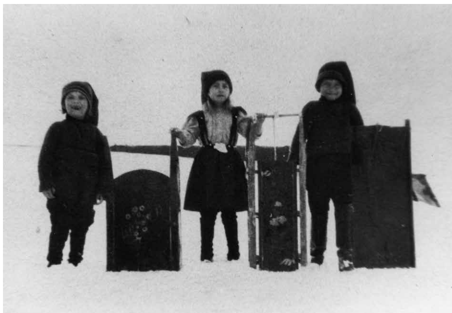
La glissade est une activité hivernale très populaire.

L'Halloween est pour les enfants une fête propice à se déguiser et à jouer des tours. Par exemple, on cache la bicyclette du voisin ou encore on place une boîte de carton attachée à une ficelle en plein milieu de la route 132