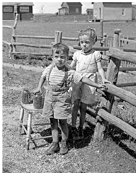
Des scènes comme celle-ci séduisent la photographe new-yorkaise Lida Moser en 1950. Cette fillette et son jeune frère attendent le passage d'une voiture de touristes pour leur vendre leurs bons bleuets, une façon de rapporter un peu de sous à la famille.

À la recherche de leur identité, les enfants expérimentent beaucoup. Pour s'amuser, les garçons particulièrement essaient de nouvelles expériences, font des mauvais coups, brisent des choses et peuvent être très malcommodes et méchants. Par exemple, pour essayer leur tire-roches et leur fusil à plomb, ils commencent par tirer sur des « canisses » et complètent l'expérience en visant des oiseaux. Qui, enfant, n'a pas fait fumer des grenouilles ou encore placé des clous sur le rail pour que le