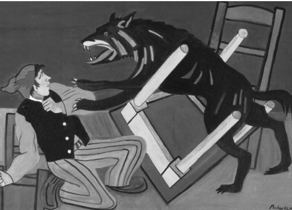
Apparition effrayante du loup-garou.

Image : huile sur toile de Claude Picher, 1995. Tirée de Légendes gaspésiennes. Illustrations de Claude Picher , Musée de la Gaspésie, 1995, p. 13.