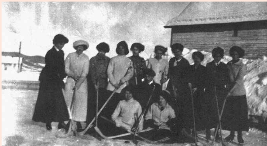
Cinq sœurs LeBoutillier jouent dans l'équipe féminine de Gaspé, à Gaspé Harbour, en 1916.