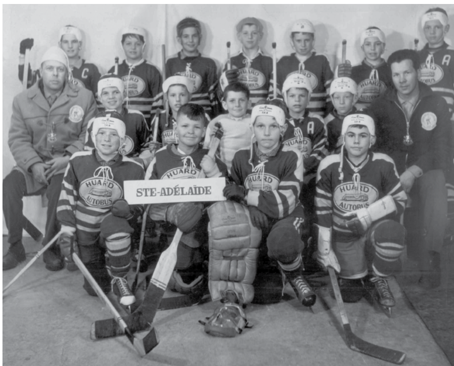
L'équipe de Sainte-Adélaïde-de-Pabos lors du tournoi pee wee de Chandler en 1966.