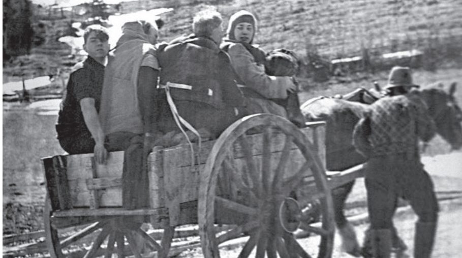
Les rescapés prennent place dans un tombereau à cheval, mai 1942.