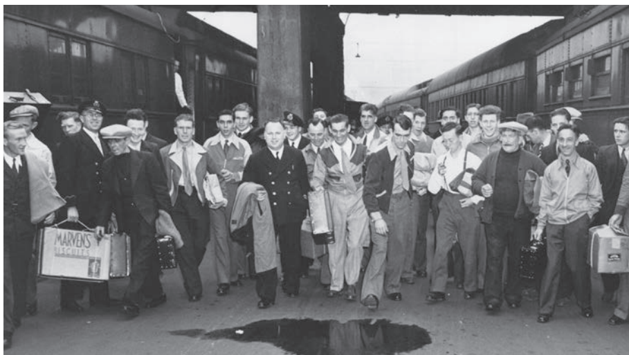
Les survivants du torpillage du SS Nicoya sont heureux d'arriver à la gare Bonaventure à Montréal, 1942.