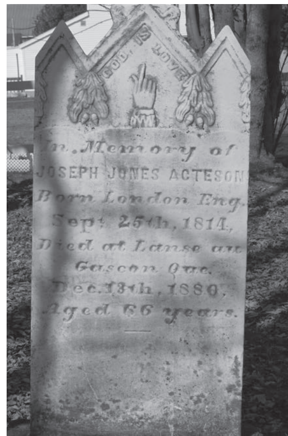
Pierre tombale de Joseph Jones Acteson.

Durant les jours suivants, au gré des marées, la mer a rejeté sur la grève quantité de produits, caisses de liqueurs, meubles, habits, denrées de toutes sortes qui, selon le récit de J.J Acteson, ont trouvé preneurs auprès des gens de l'endroit. Quant aux 40 boîtes scellées, cinq d'entre elles ont été retrouvées et expédiées à Québec. Mais il en restait 35 dont on a complètement perdu la trace. Quant aux survivants, ils ont été secourus par les familles des pêcheurs locaux.