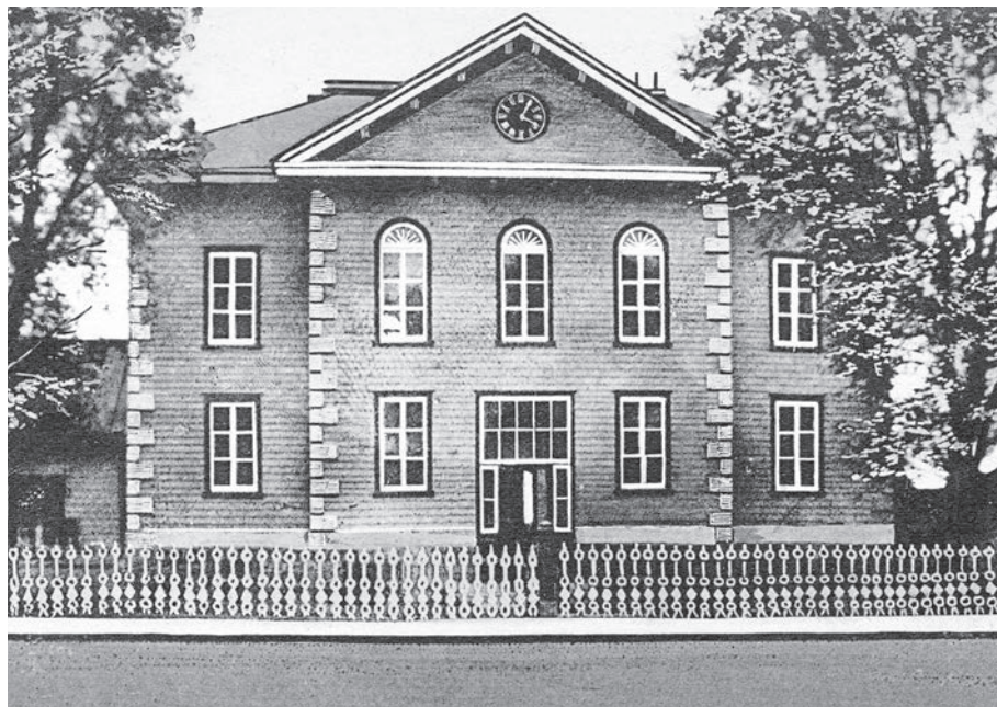
Le palais de justice de New Carlisle, construit vers 1820, est le symbole de ce que représente cette localité en tant que centre administratif et judiciaire de la Gaspésie au 19 e siècle.

Au début du XIX e siècle, la population de la péninsule comptait environ 3 000 âmes et l'économie de la région était l'une des plus dynamiques du pays : l'agriculture, la construction navale, la pêche et la forêt étaient les secteurs les plus florissants. La communauté d'expression anglaise y dominait le paysage économique, social et politique. Sur les 37 nominations politiques recensées entre 1791 et 1841, seules quatre visaient des francophones. En 1851, la population totale était passée à 19 546 habitants, dont la moitié d'expression anglaise. La population anglophone se regroupait principalement dans la région de la Baie-des-Chaleurs et en 1861 elle comptait pour 5 % des anglophones du Québec.