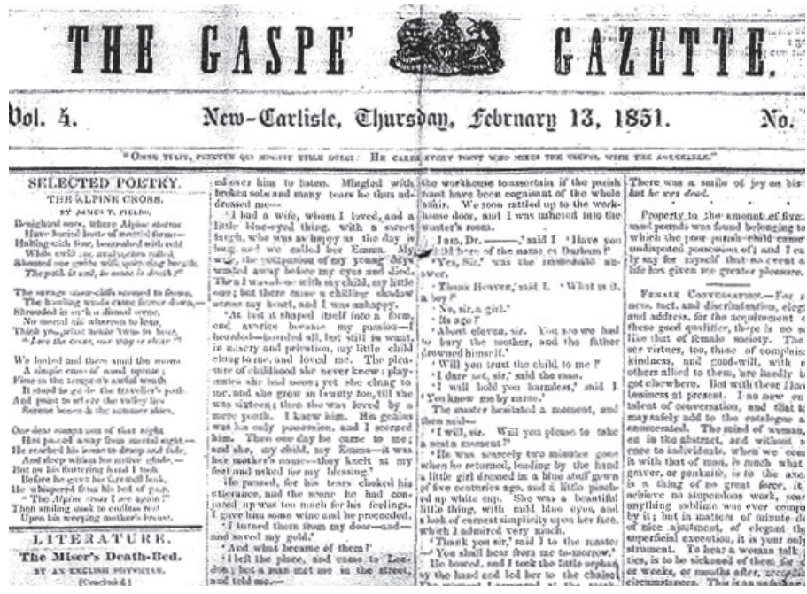
En 1848, les anglophones publient le premier journal en Gaspésie, The Gaspé Gazette .

À cette époque, Montréal, Québec, la vallée de l'Outaouais et les Cantons de l'Est étaient aussi des régions comptant un bon nombre d'anglophones. En 1871, la communauté anglophone de Gaspésie était composée principalement d'Anglais (33 %), d'Irlandais (32 %) et d'Écossais (20 %). Trente-cinq pour cent de cette population était catholique.