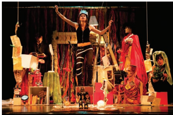
Éclats et autres libertés.