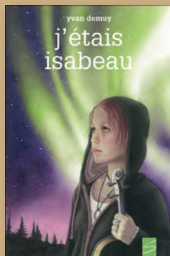
J'ÉTAIS ISABEAU de Yvan de Muy 13 ans + / 124 p. / 11,95 $