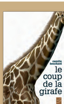
LE COUP DE LA GIRAFE de Camille Bouchard 13 ans + / 106 p. / 12,95 $