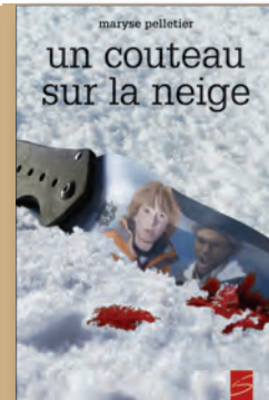
UN COUTEAU SUR LA NEIGE de Maryse Pelletier 13 ans + / 168 p. / 11,95 $ Prix Alvine-Bélisle 2011