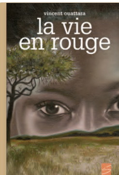
LA VIE EN ROUGE de Vincent Ouattara 15 ans + / 160 p. / 11,95 $ Sélection White Ravens 2009