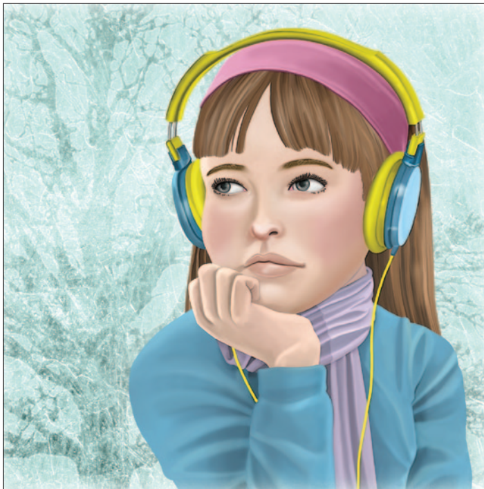
illustration : Laurine Spohner

Elle est donc bien longue, cette panne! On se dépêche d'entrer ou sortir de la maison. On est correct, il ne fait pas encore si froid. Chacune dans nos chambres, c'était frisque, mais une fois ensemble au salon sous nos trois sacs de couchage, on est bien. Aujourd'hui, on a mis des piles dans la radio. Aux nouvelles, ils ont annoncé que