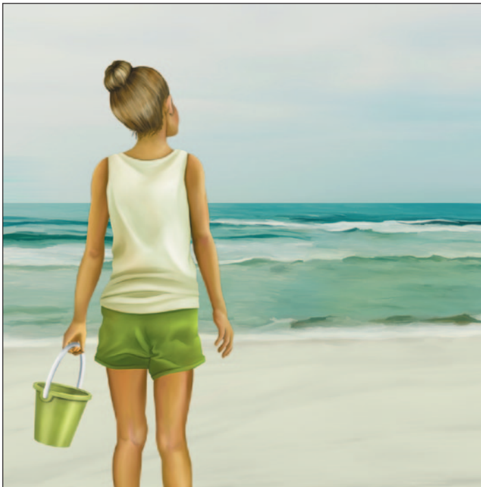
illustration : Laurine Spehner

Je ne suis jamais allée à la plage. La vraie, je veux dire, celle qui a des vagues turquoise et qui laisse sur les lèvres un gout plus salé encore qu'un sac complet de chips sel et vinaigre. «Pourquoi chercher la mer quand nous avons ici le plus majestueux des estuaires?» nous a souvent répété papa, à maman et moi. Je faisais chaque fois semblant de le croire. Si papa avait eu un peu de sous, il nous y aurait amenées sur-le-champ, je le sais bien. Juste pour nous voir heureuses.