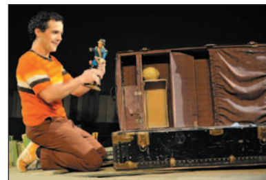
Conte de la neige.