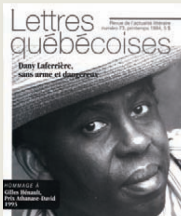
Danny Laferrière en noir et blanc!

liste au Prix du Conseil des arts de la Communauté urbaine de Montréal. Et puis, quelques années auparavant, Lettres québécoises avait reçu les félicitations du jury de ce même Conseil des Arts du Canada pour sa qualité !