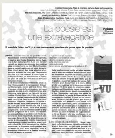
Une page olé ! olé ! du numéro 58. Pas facile à lire !