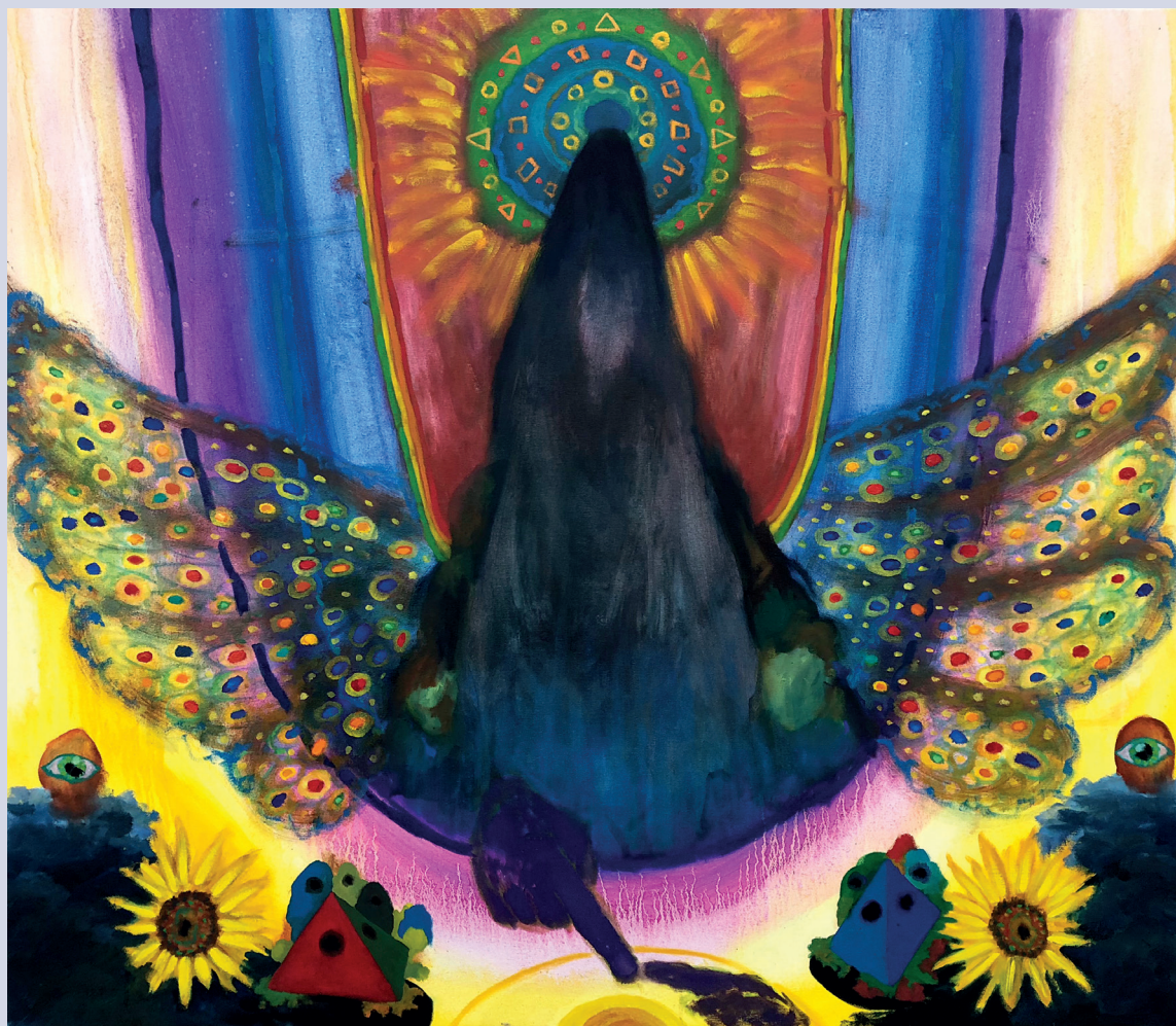
Benjamin Klein. Harbinger , 2020, huile sur toile, 38 x 44 pouces.

Klein s'intéresse au pouvoir symbolique et visuel des icônes religieuses ou mystiques. Dans cette série, on trouve ainsi des figures d'anges, mais sans qu'elles soient associées à des références religieuses précises, car c'est avant tout leur puissance évocatrice que l'artiste cherche à exploiter. Klein, qui se décrit comme agnostique, me confie sa fascination pour ces « êtres intermédiaires » qui jouent le rôle de messagers, de gardiens ou d'annonceurs, comme la figure du sphinx qui livre aux hommes des énigmes à déchiffrer. Ancrées dans le temps, ces figures ont su traverser les époques, me dit-il, car elles ont toujours des choses à nous apprendre.