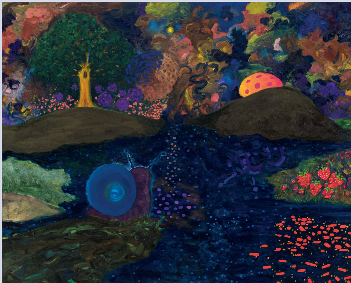
Benjamin Klein. Two of us , 2014, huile sur toile, 60 x 75 pouces.

• La peinture de Klein s'inscrit dans le sillage de l'évolution de la peinture contemporaine, telle qu'elle s'exprime, par exemple, chez des peintres comme l'éco-sais canadien Peter Doig ou le britannique Chris Ofili. Les œuvres de ces derniers s'ouvrent sur des mondes sensoriels et oniriques empreints d'une aura subjective qui a su capter l'intérêt d'un grand public. En réaction aux mouvements issus du fameux essai de Douglas Crimp, « The end of painting », paru en 1981, ces artistes ont cherché à défendre la peinture figurative en renouant avec plusieurs mouvements du 20 e siècle, comme le romantisme, le symbolisme et l'expressionnisme. Dans le cas de Klein, je ne serai pas la première à faire un rapprochement avec le peintre Odilon Redon, ou encore avec Chagall, pour la richesse de ses couleurs et les