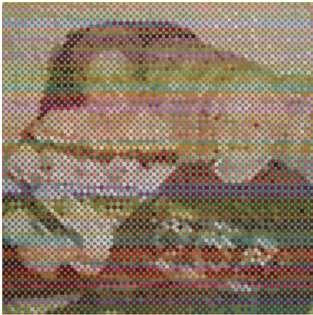
Mark Stebbins, Grandmothers , 2017, acrylique sur panneau de bois, 8" x 8".

laissant le soin au cerveau d'assurer le mélange optique des deux couleurs pour créer une impression de vert). Comme les pointillistes, Stebbins crée des vibrations lumineuses en juxtaposant des points de couleurs qui font appel à la faculté de synthèse du cerveau.