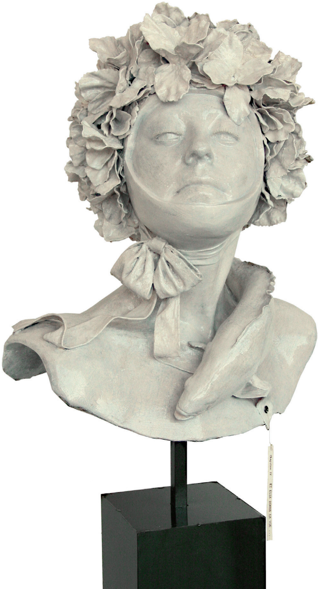
SCULPTURE BY THE FINE ARTS SOCIETY OF THE UNIVERSITY OF CALIFORNIA