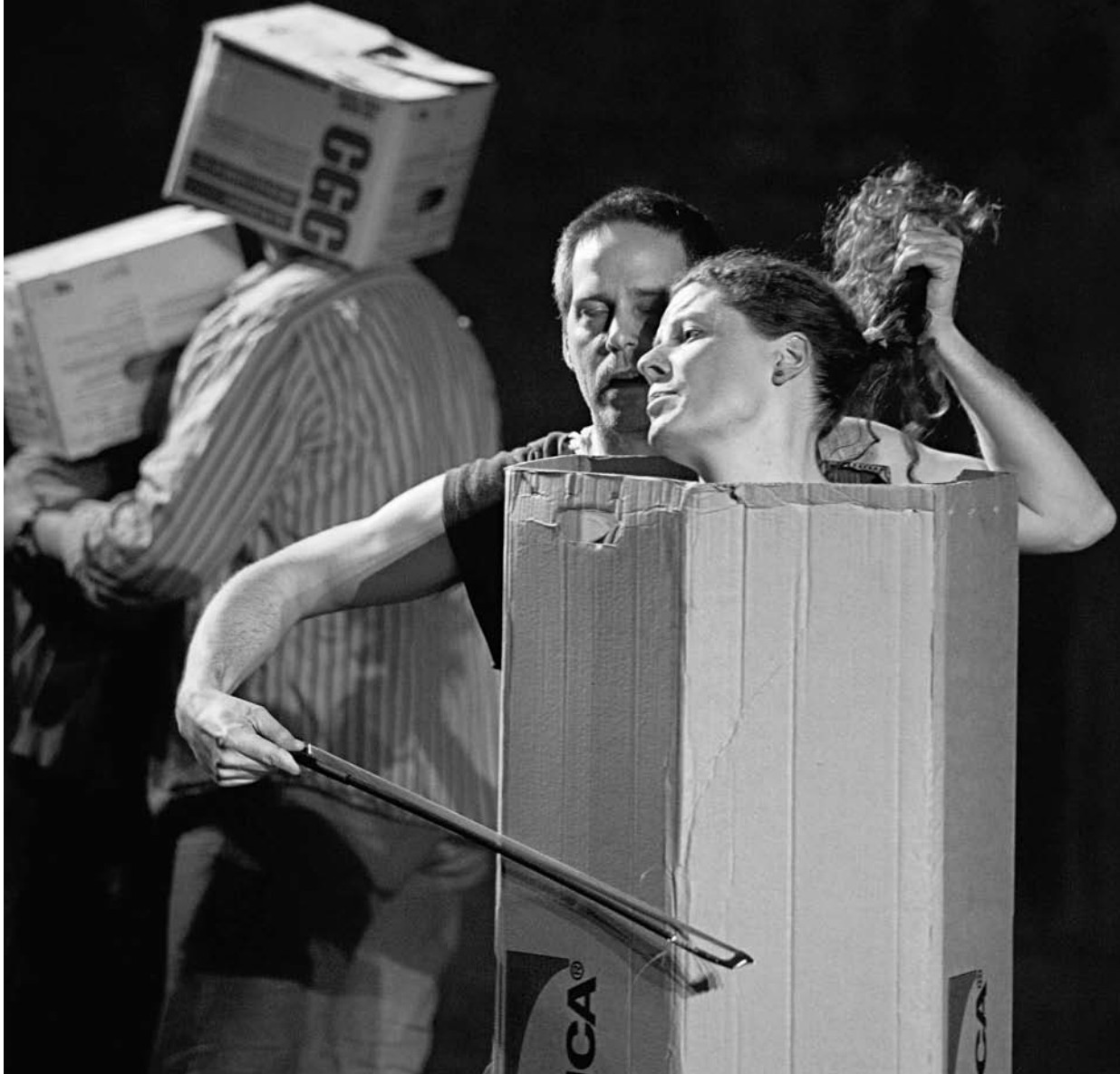
Ronfard nu devant son miroir (NTE, 2011). © Michel Ostaszewski.