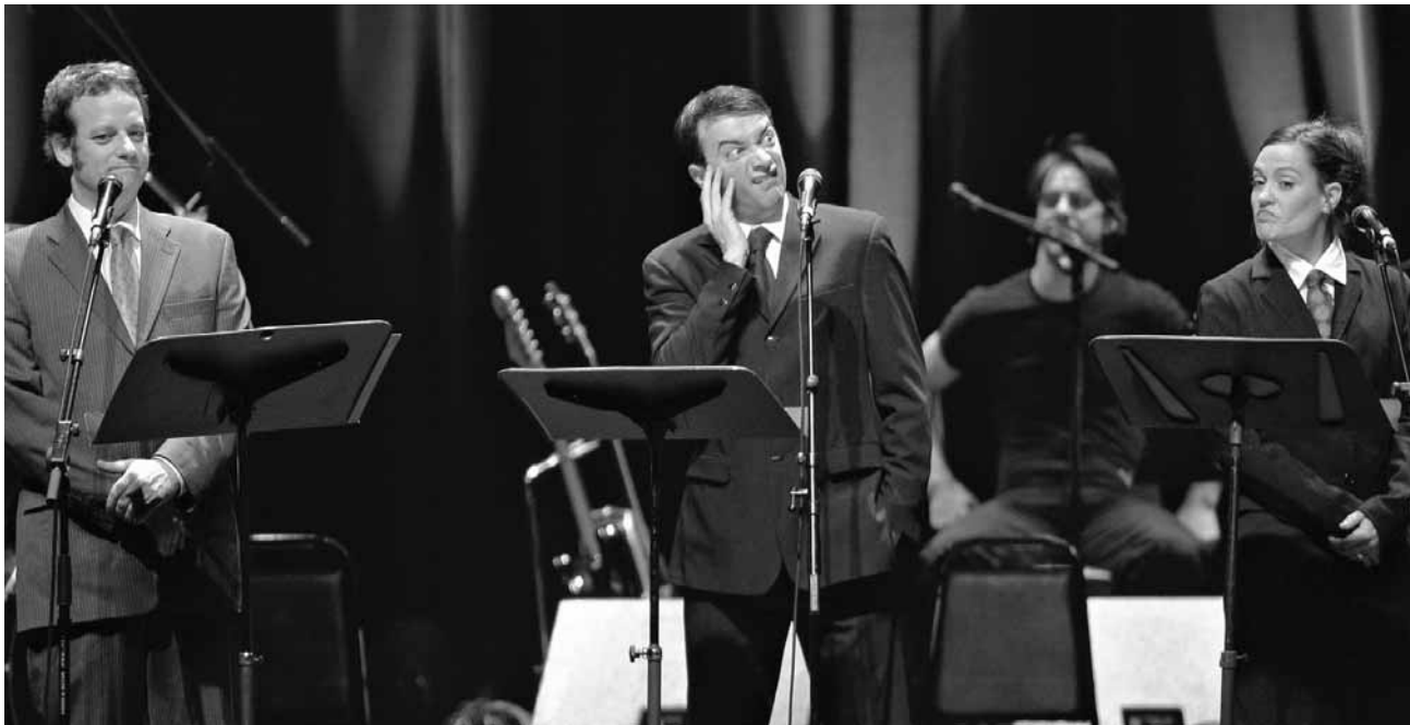
Les Zapartistes. © Pascal Rathé.