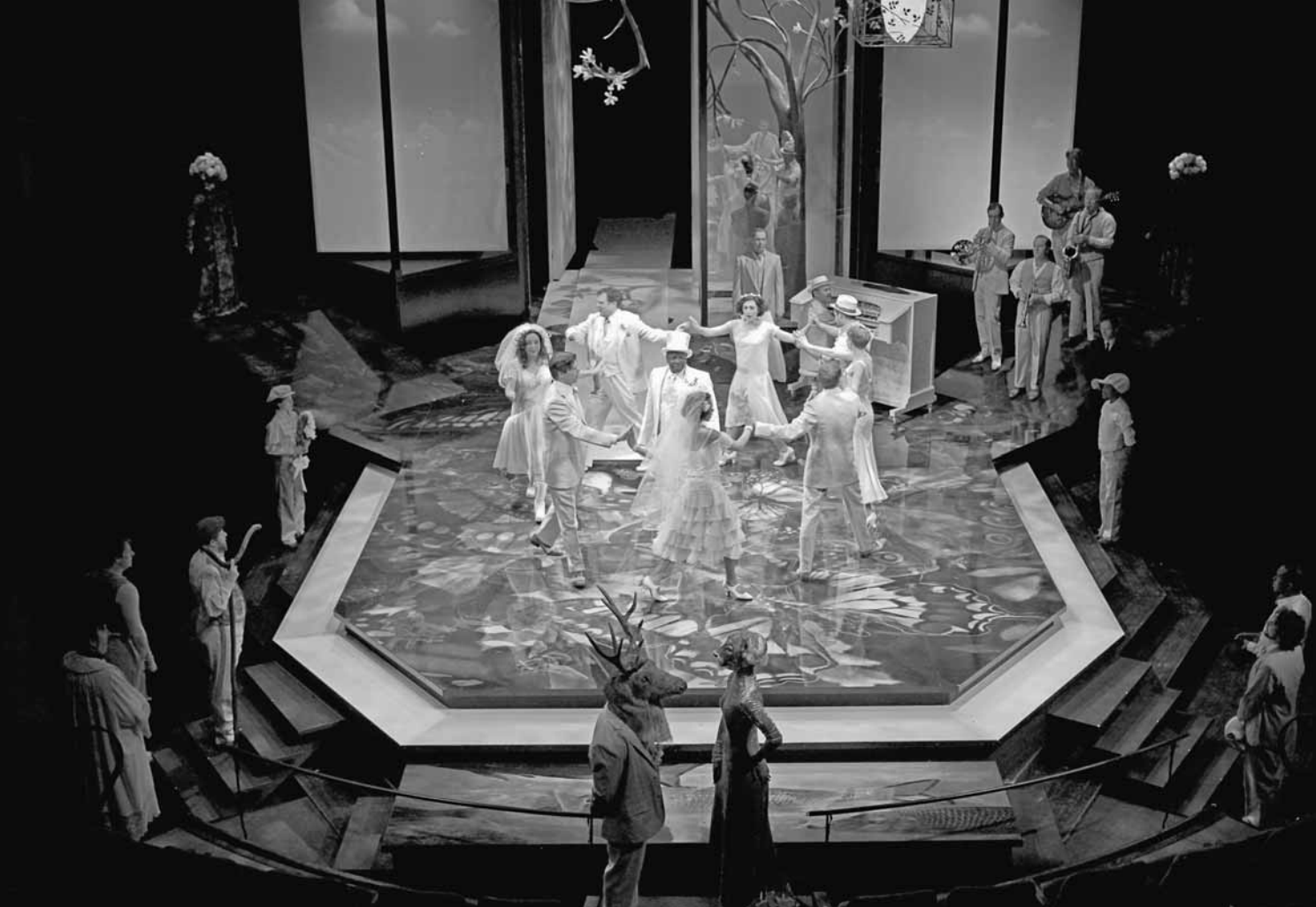
As You Like It , mis en scène par Des McAnuff au Festival de Stratford 2010.

non seulement le noyau de la comédie, mais le cœur de toute interprétation de la pièce, qu'on en fasse maintenant une lecture patriarcale ou, au contraire, qu'on en souligne la subversion des rôles sexuels. Mais, grâce à la scénographie de Debra Hanson, c'est plutôt la forêt d'Arden qui devient elle-même le personnage principal de la pièce ou peut-être, plus exactement, un tableau vivant que composent les acteurs et les figurants lorsque, en posant à l'arrière-plan, ils semblent vouloir arrêter l'action. Aux côtés des corps de femmes exhibant des attributs mâles (Rosalinde et sa compagne Célia), on trouve donc des hommes et des femmes arborant sur leurs épaules de gigantesques bouquets de fleurs ou des têtes d'animaux. Ces métamorphoses qui engagent non seulement les sexes, mais les règnes végétal et animal, pourraient être un clin d'œil à Ovide, qu'affectionnait beaucoup Shakespeare. Elles apparaissent toutefois surtout comme des références à l'art surréaliste, et plus particulièrement à Magritte et Dalí.