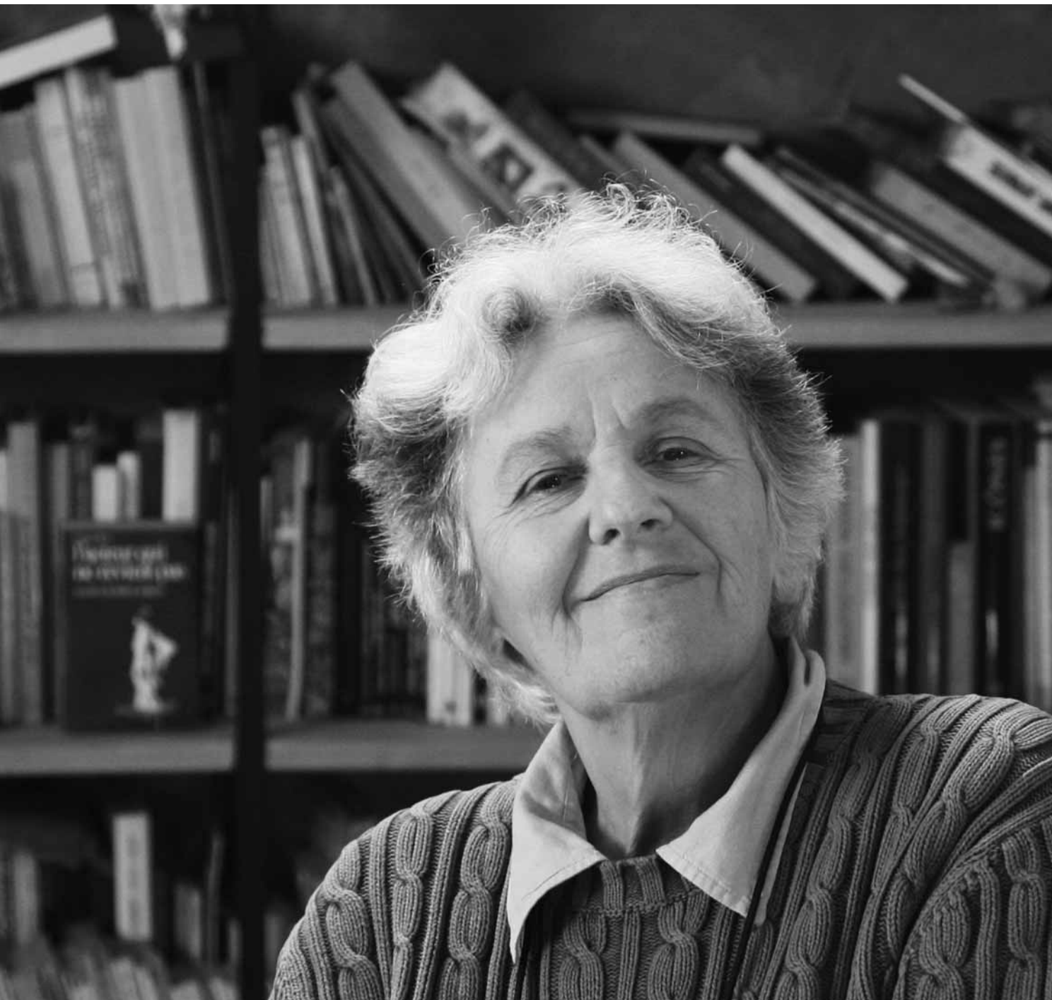
Photo tirée du film de Catherine Vilpoux, Ariane Mnouchkine. L'Aventure du Théâtre du Soleil , présenté au Festival international des films sur l'art en mars 2010.