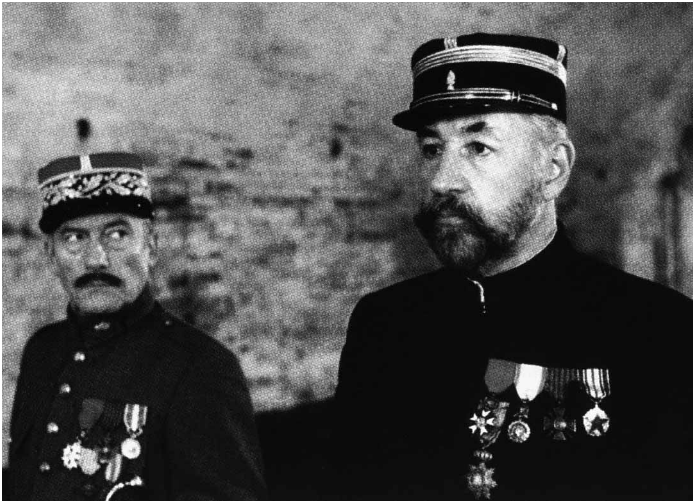
Philippe Noiret dans une scène de la Vie et rien d'autre de Bertrand Tavernier (1989) où il porte les décorations de son père.

comédie, il disait, se rappelle Monique Chaumette, qu'il fallait retrouver la ligne pure de Matisse. Il prétendait, du reste, ne pas être comique : ce sont les textes ou les situations qui le sont. Ses rôles étaient souvent teintés de cette mélancolie qui habitait l'homme, tout bon vivant fût-il (même seul, il adorait se trouver devant un bon repas). Tavernier évoque cette tristesse qui conférait à ses personnages leur humanité.