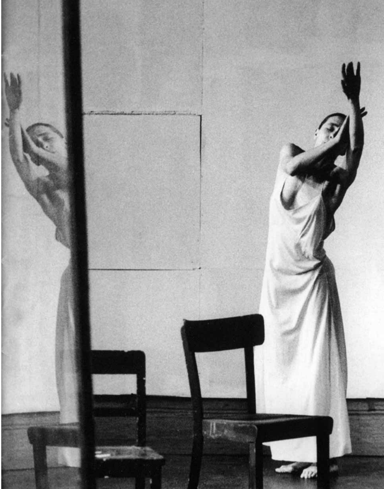
Pina Bausch dans Café Müller (1980).