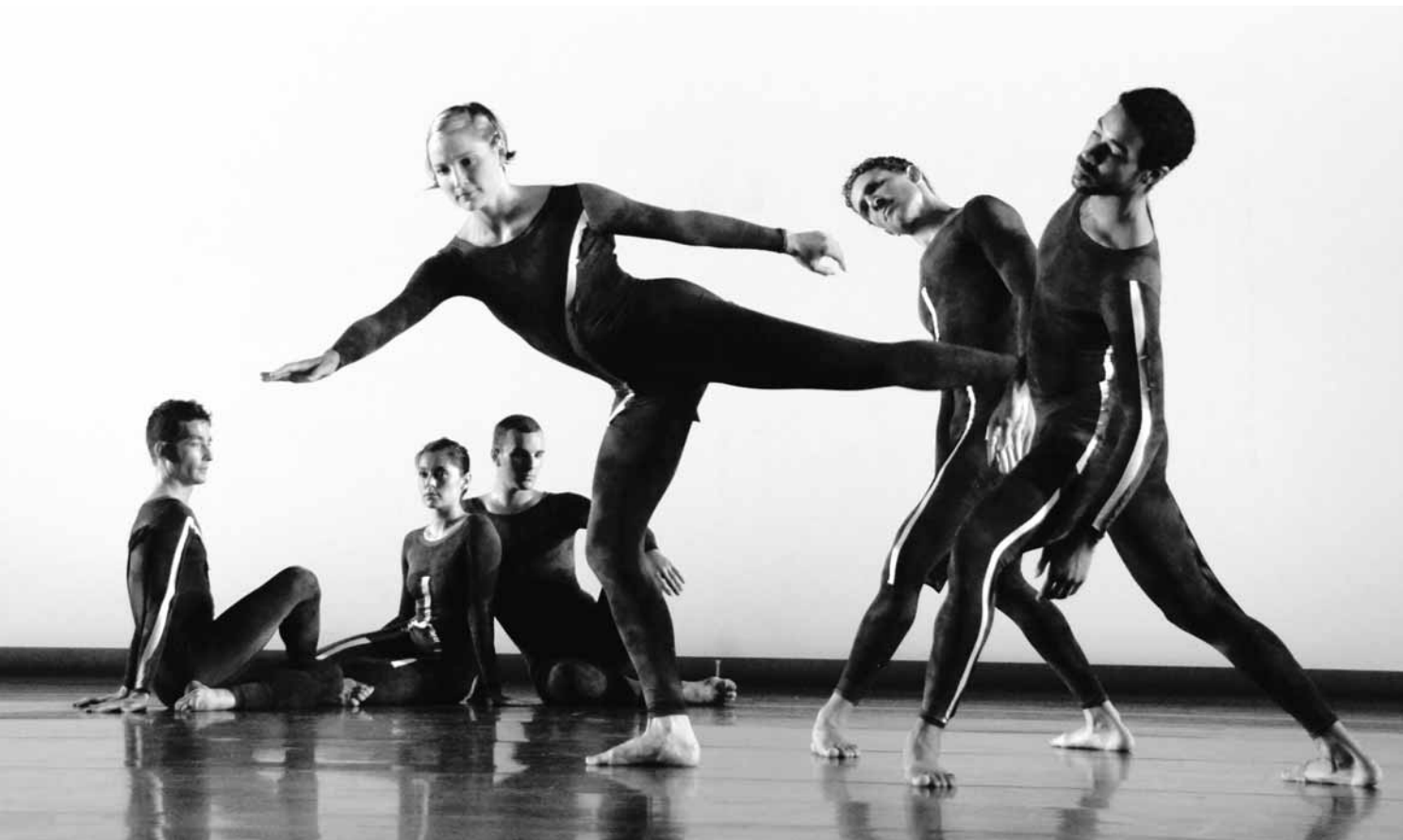
Nearly 90 2 , dernier spectacle de la Merce Cunningham Dance Company, sera présenté au FTA 2010.