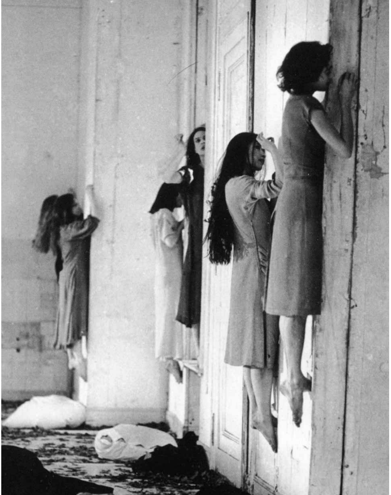
Barbe-Bleue (1977) de Pina Bausch, inspirée de l'opéra de Bartók.