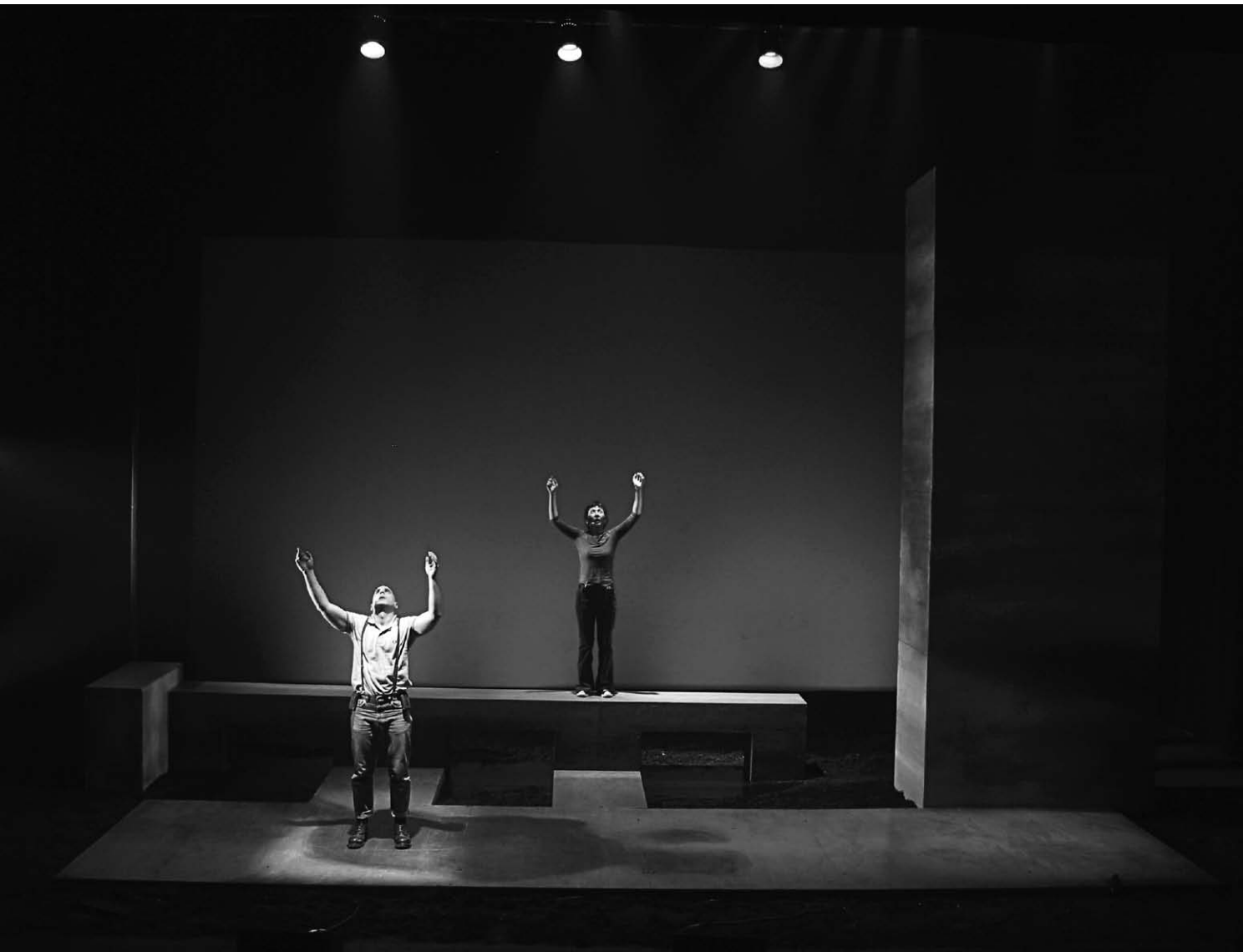
La Noirceur de Marie Brassard (Infrarouge/FTA/CNA, 2003).