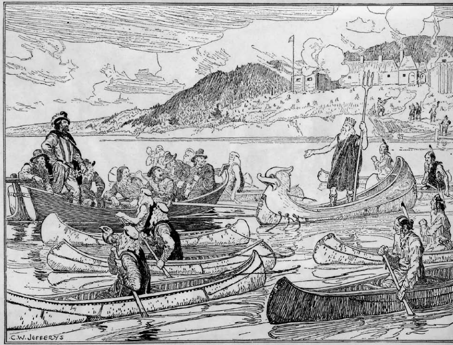
Le Théâtre de Neptune en la Nouvelle-France de Marc Lescarbot, première pièce présentée en Amérique française, a été donnée à Port-Royal en 1606. Illustration tirée de The Picture Gallery of Canadian History de C.W. Jefferys, vol. 1, Toronto, The Ryerson Press, 1942, p. 83.

mélioratif ou péjoratif sur le sociolecte des personnages. L'absence d'un véritable dialogue entre les locuteurs de langues différentes en constitue le second trait. Syndrome de Babel, si l'on veut. C'est avant que l'on ne présente sous un jour heureux, postmodernisme ou multiculturalisme aidant, cette hybridité linguistique, cette hétéroglossie. Point de vue que les artisans de la scène mettront beaucoup de temps à adopter au Québec, particulièrement les francophones, puisque la langue parlée rend aussi compte des rapports de force et des tensions sociales travaillant la cité.