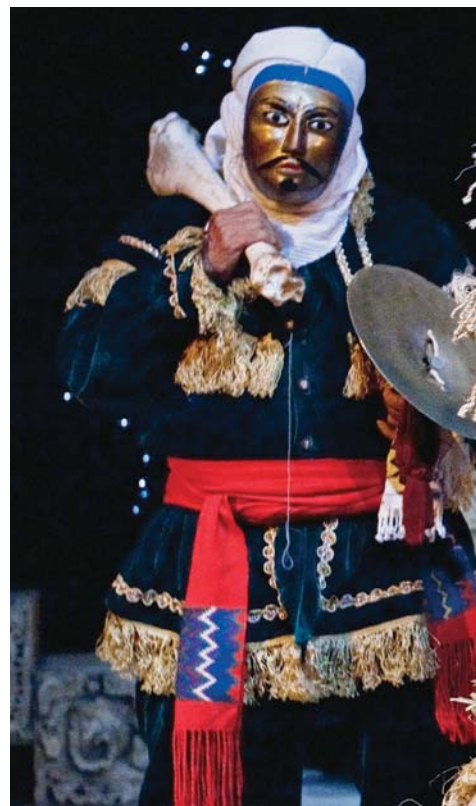
Xajoj Tun Rabinal Achi , mis en scène par Yves Sioui Durand (Théâtre Ondinnok, 2010).

où Taylor a représenté les contradictions qui surgissent dans l'univers d'une communauté autochtone autour du projet d'établissement d'un casino, Côté reconnaît l'analyse des conflits sociaux et les procédés de distanciation qui ont défini le théâtre avant-gardiste de Bertolt Brecht.