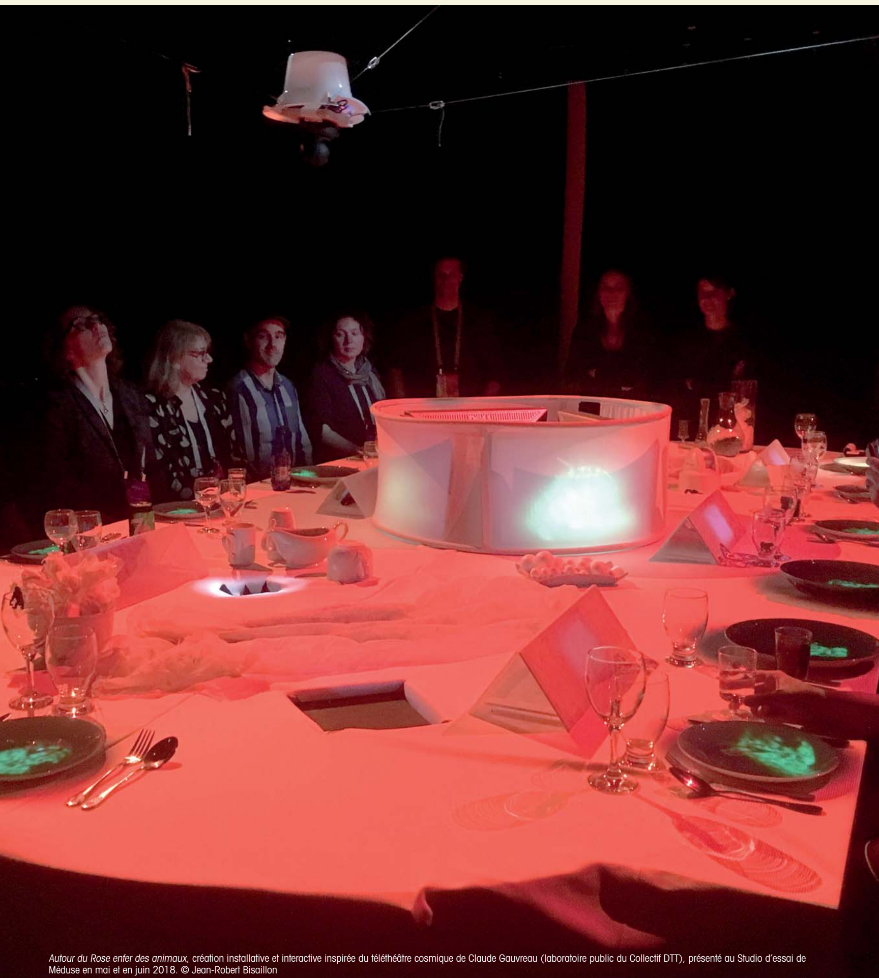
Autour du Rose enfer des animaux , création installative et interactive inspirée du téléthéâtre cosmique de Claude Gauvreau (laboratoire public du Collectif DTT), présenté au Studio d'essai de Méduse en mai et en juin 2018.