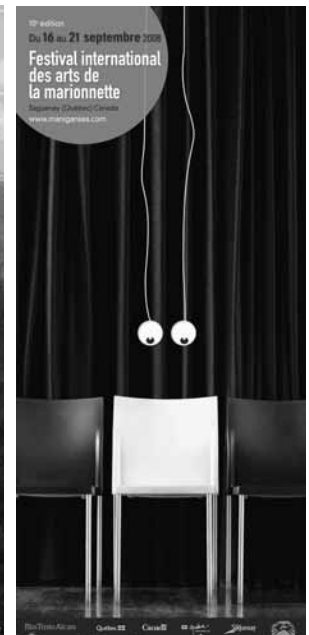
Trois affiches de l'événement international du Saguenay-Lac-Saint-Jean.