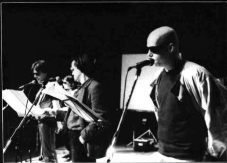
The Woeurks, de Gilles Arteau.