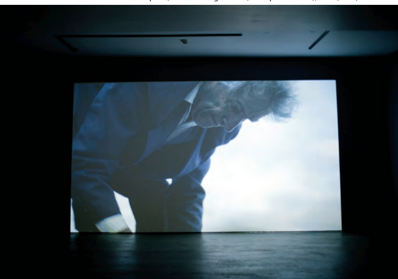
> Jacynthe Carrier, CYCLÉS (œuvre vidéo), Lévis, 2014.