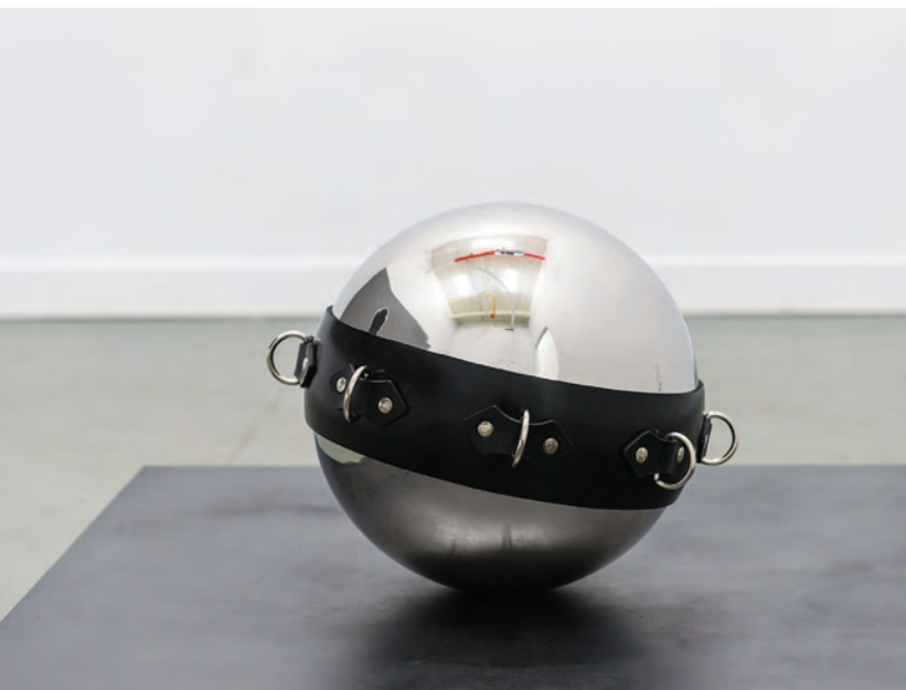
> Mathieu Beauséjour, La banque du Soleil , galerie ertaskiran, Montréal, 2014.