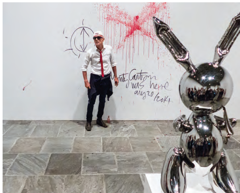
> Monty Cantsin, Le cadeau suprême , 2014.