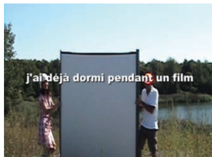
Le soleil brille pour tout le monde mais les hommes préfèrent les blondes (2008) de Sylvie Laliberté

Il y a dans ce Mémorial une salle où siègent des bustes de personnages historiques de l'époque. Sur chacun est projeté le visage d'un habitant marseillais anonyme d'aujourd'hui.