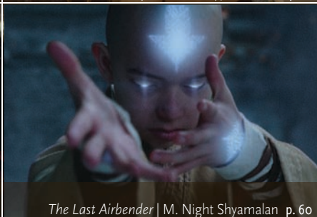
The Last Airbender | M. Night Shyamalan p. 60