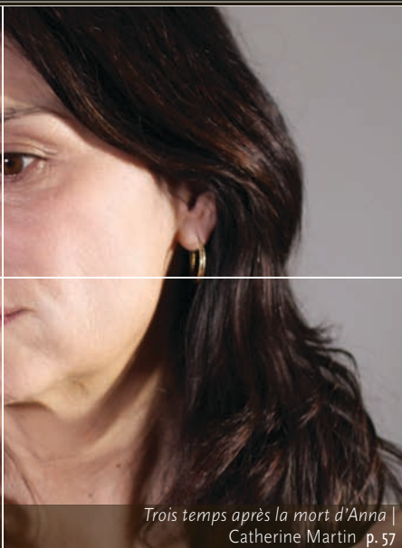
Trois temps après la mort d'Anna | Catherine Martin p. 57