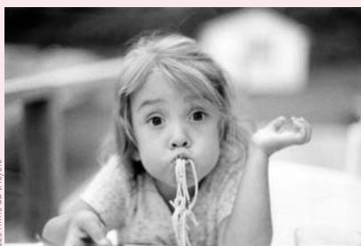
Les films du tricycle